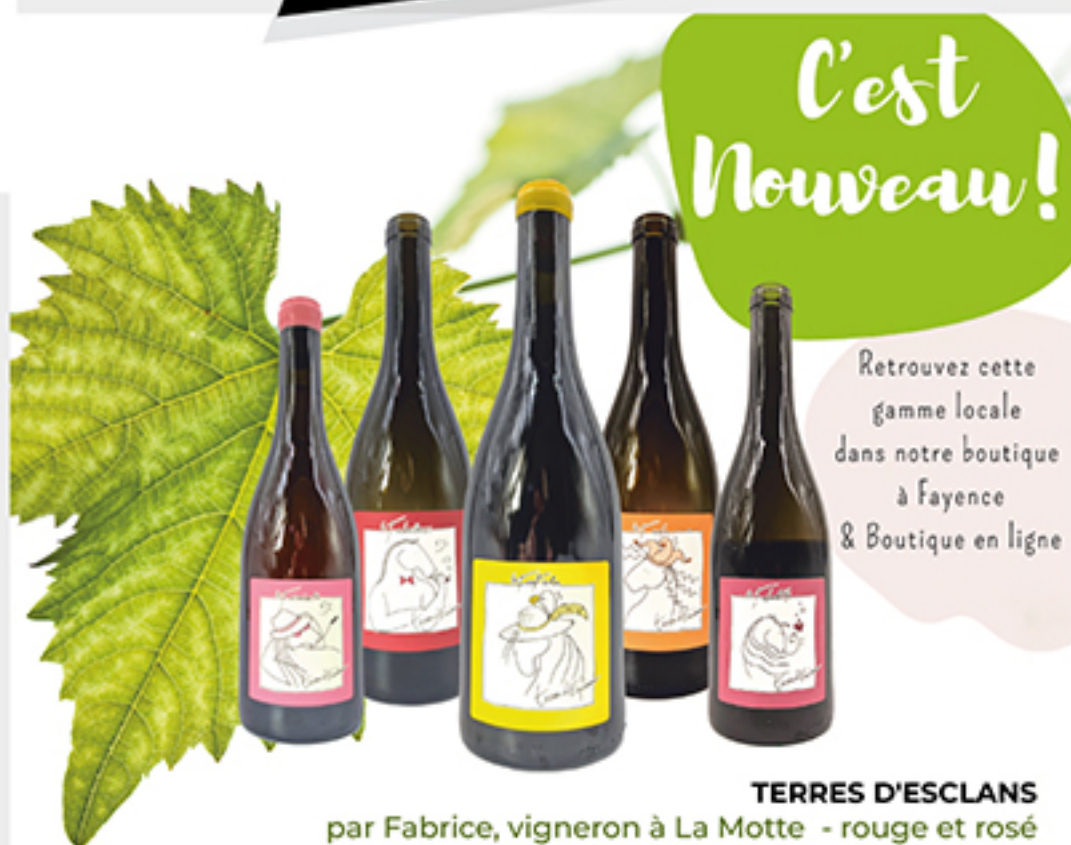
TERRES D'ESCLANS par Fabrice, vigneron à La Motte - rouge et rosé

Retrouvez cette gamme locale dans notre boutique à Fayence & Boutique en ligne