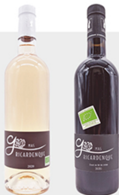
MAS RICARDENQUE par Pascal, vigneron à Callian rouge et rosé